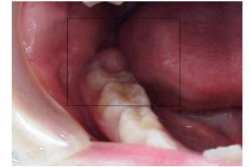
写真④（歯肉弁の肥厚）

④の写真のような場合は局所麻酔下で⑤の写真の電気メスを使用し、歯肉弁を切除します。